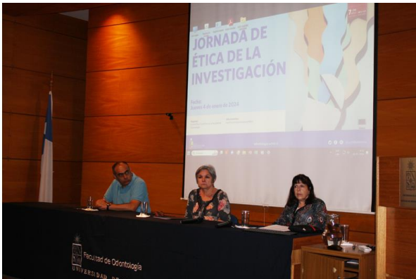
Figura 2: Sra. Decana, Sr. Vicedecano. Autoridades de la Facultad de Odontología asistentes a la inauguración de la Jornada de Ética de la Investigación.

En el ANEXO 1 Se presenta el Programa de la Jornada