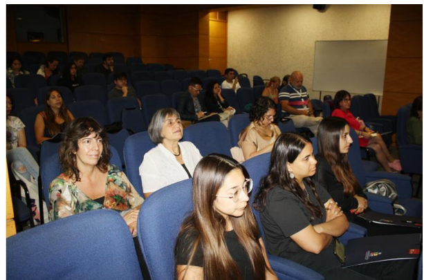
Figura 3: Comunidad odontológica asistente a la Jornada de Ética de la Investigación.