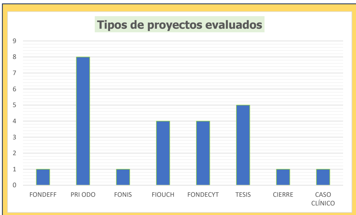
Gráfico 1: Tipos de proyectos ingresados al CEC durante el año académico 2023.

Los proyectos FIOUCH, son proyectos concursables con financiamiento interno. Por el contrario, los proyectos PRI ODO, se inscriben en la Dirección de Investigación para su aprobación y no tienen financiamiento.