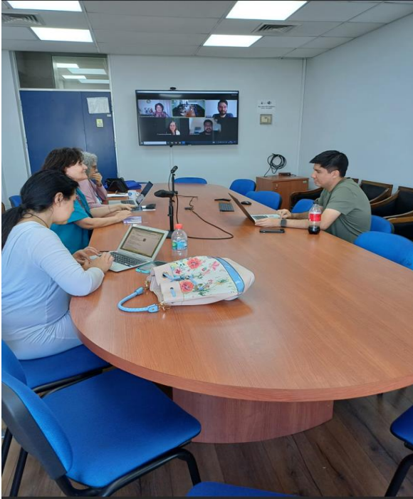
Figura 1. Miembros CEC en sesión ordinaria modalidad híbrida, presencial y remota.