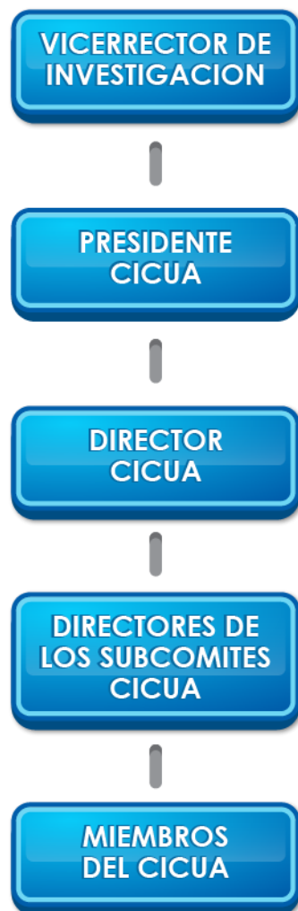
Figura 2. Estructura organizacional del CICUA.

Para la Universidad de Chile se propone que el CICUA responda e informe directamente al Vicerrector de investigación de turno, de acuerdo al siguiente esquema: